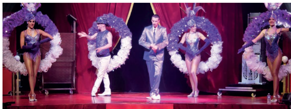
Repas des seniors et thé dansant

V ieux-Condé est une ville festive et nos aînés ne sont pas en reste. Tout au long de l'année, entre événements récurrents et fêtes ponctuelles, nos seniors participent à de nombreuses animations. Extraits choisis.